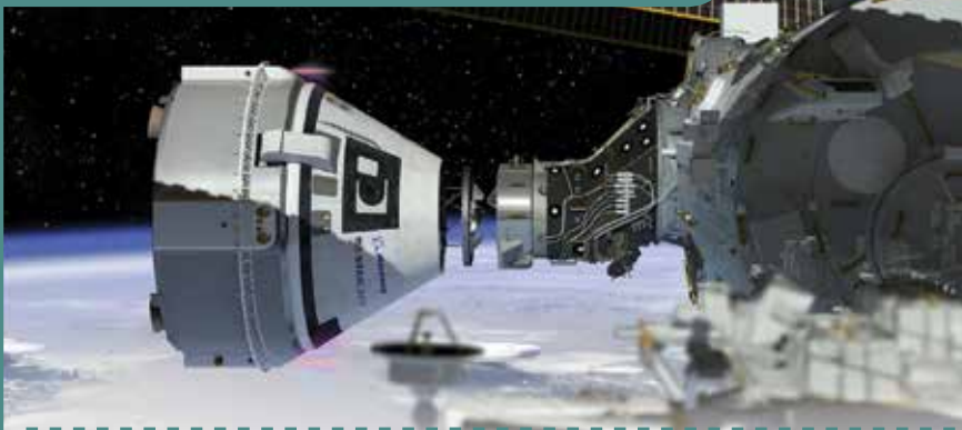
En junio de 2019 la NASA anunció que permitirá visitas de turistas a la EEI a bordo de vehículos de SpaceX o Starliner de Boeing.