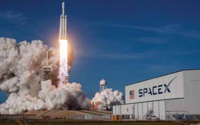
Lanzamiento del Falcon Heavy de SpaceX.